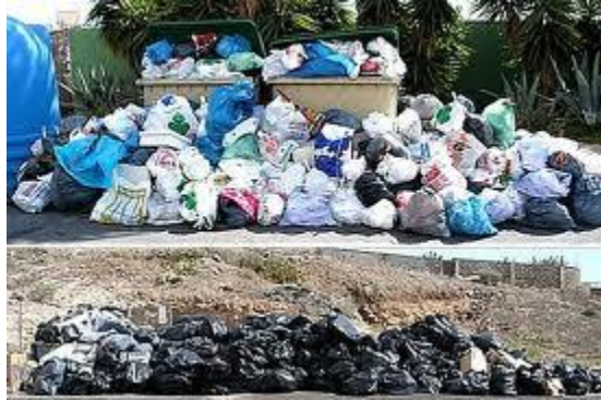
Acumulación de basura