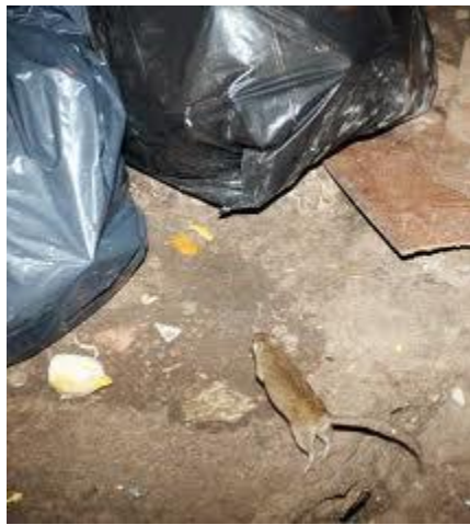
Reproducción de organismos causantes de enfermedades