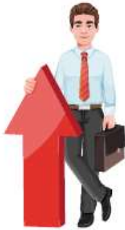
hombre de negocios