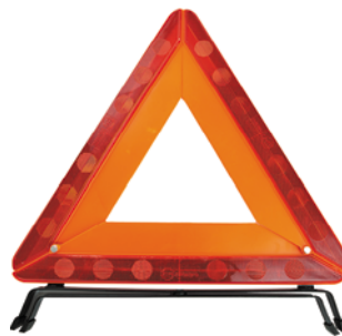
Un triángulo reflectivo de seguridad.