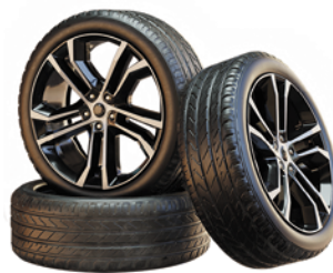
Llanta de repuesto.