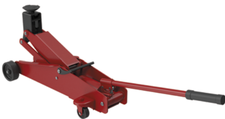
Un elevador mecánico con capacidad para levantar el vehículo.