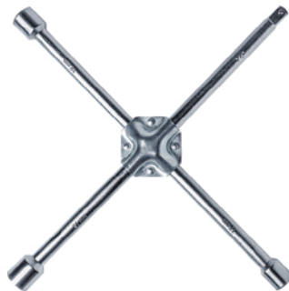
Herramientas para el reemplazo de las llantas.