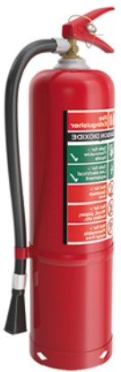
Un extintor de incendios