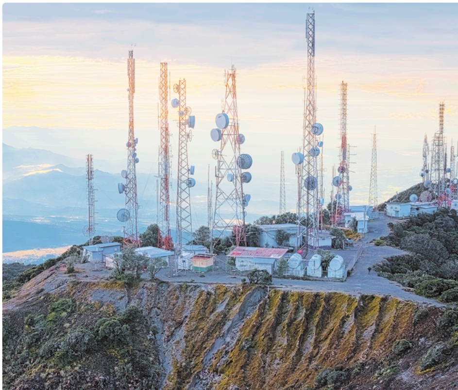
Debido a su relieve, en la provincia de Chiriquí se encuentran antenas transmisoras de radio y televisión y torres para comunicaciones.

El clima de la provincia es variado debido, en especial, a la diversidad de altitudes. En las zonas más elevadas domina el clima de montaña media y alta con temperaturas frescas, alrededor de 18°C y abundantes lluvias. También se presenta el clima oceánico de montaña baja.