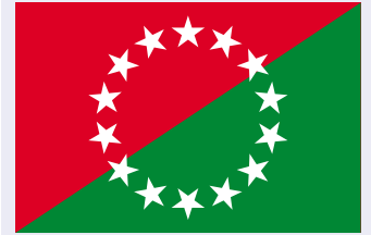
Bandera de la provincia de Chiriquí.