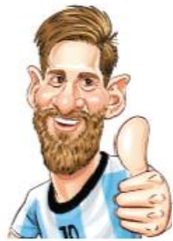
Lionel Messi, futbolista argentino

→ Caricaturas . Son dibujos humorísticos, no propiamente textos, que exageran o distorsionan la apariencia física de una o varias personas. Por ejemplo: