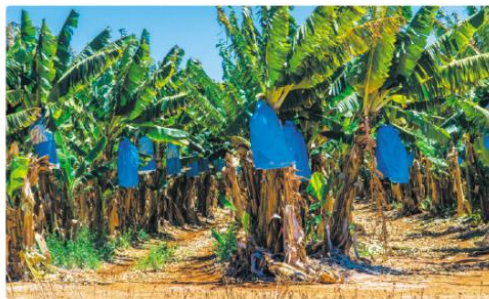
Plantaciones de banano en Changuinola, Bocas del Toro