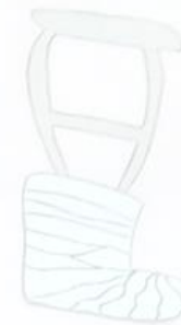
La falta de movilidad... El estudiante con discapacidad... ...debe tener acceso a los contenidos... ...de la asignatura... ...mediante... ...adecuaciones...

se deriva un mayor número de opciones que deben corresponderse con la realidad de cada escuela, el aula y, principalmente, con las necesidades educativas especiales de los alumnos; la magnitud, Profundidad, variedad y características de las adecuaciones estarán determinadas por esta realidad.